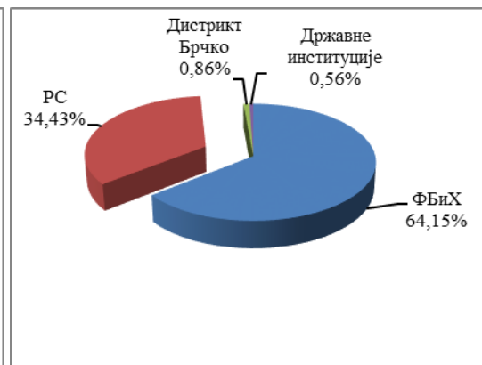
Графикон 2. % учешћа према извршеној алокацији обавеза у сервисираним обавезама